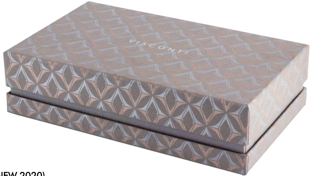
BOX-12 (NEW 2020)

L'interno del box è foderato di un soffice tessuto grigio e consiste in un pianetto estraibile che lascia spazio sul fondo per la garanzia ed eventuali extra refill.